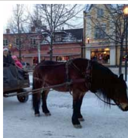
GRIM, JULMARKNAD.

"Så som i Enköping" med skörde-marknad på Stora Torget. Arr: Enköpings Kommun, Enköpings Centrumsamverkan, Lions, föreningar, studieförbund och företag.